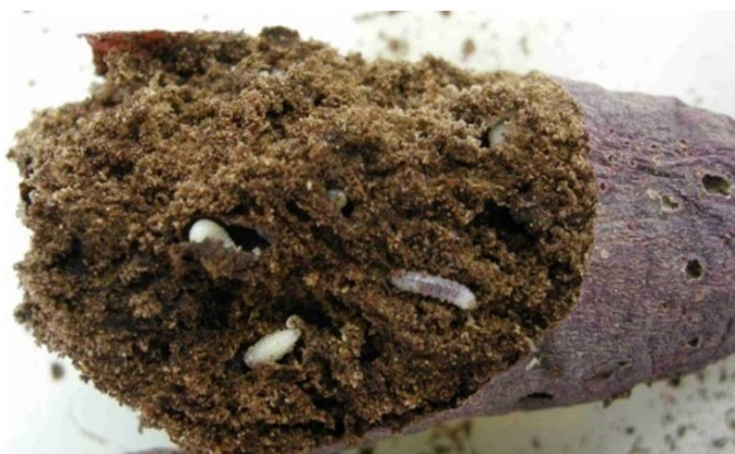
さつまいもの被害(アリモドキゾウムシ)

既に根絶が達成されたウリミバエについては、根絶後も台風といった気象要因等による再侵入事例がある。このため、発生地からの再侵入の防止措置を講じていく必要があり、不妊虫放飼による対策を継続して、ウリミバエの定着を防止。