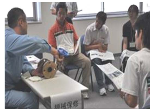
現地技術者との交流