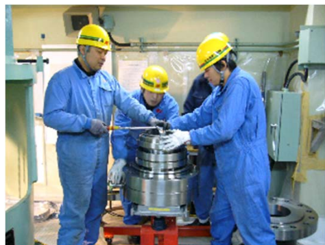
モックアップ設備を使用した訓練