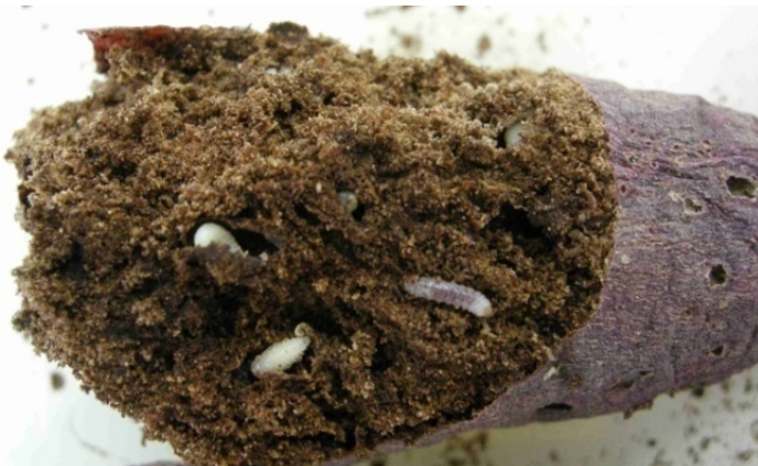
サツマイモの被害 (アリモドキゾウムシ)